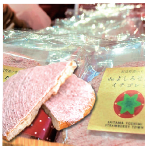
The よしみせんべい イチゴレッド 131円 (税込)

吉見町産いちご100%使用。 風味豊かなイチゴバターです。 万能スプレッドなのでパンや アイス、クラッカーに乗せて ご賞味ください。