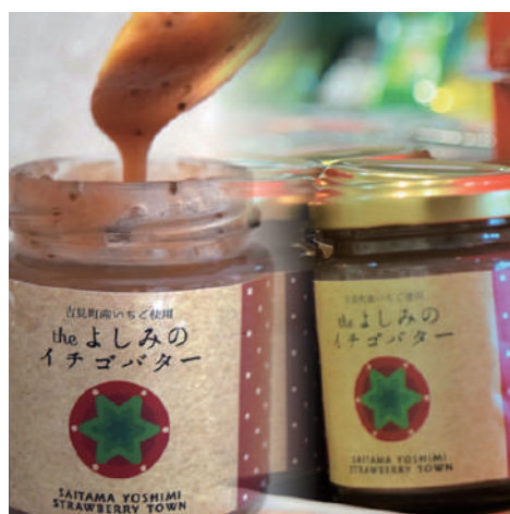
The よしみのイチゴバター 562円 (税込)

吉見町産いちご100%使用。 風味豊かなイチゴバターです。 万能スプレッドなのでパンや アイス、クラッカーに乗せて ご賞味ください。