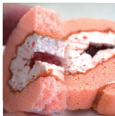
The よしみロール 270円 (税込)

吉見町産のいちごパウダーを コーティング。ほんのりと甘酸 っぱい素朴な美味しさです。